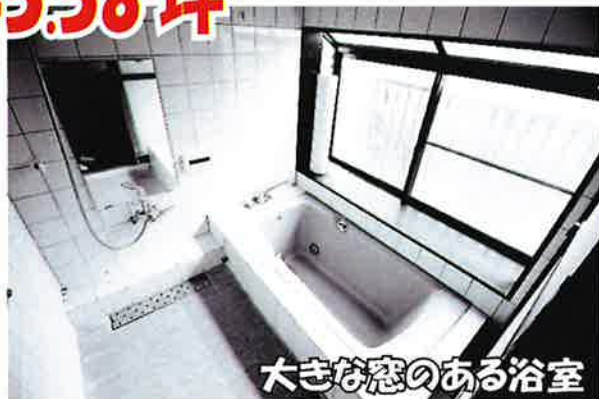
大きな窓のある浴室