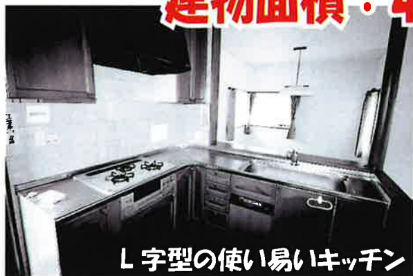
L字型の使い易いキッチン