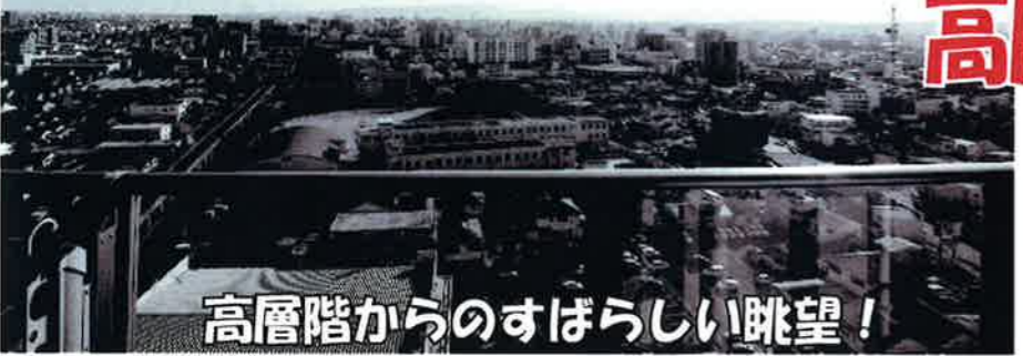
高層階からのすばらしい眺望!

今回ご紹介するお部屋はとにかく113.87㎡と広い!! 宮崎では数少ない免震構造であることや、入居者に 嬉しいゴミ回収サービスなどの環境も整っており、 大変おすすめのマンションです!是非この機会に ご覧になりませんか?お問合せお待ちしております☆