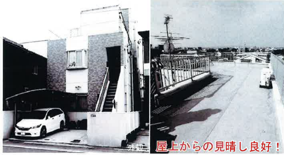
屋上からの見晴し良好!