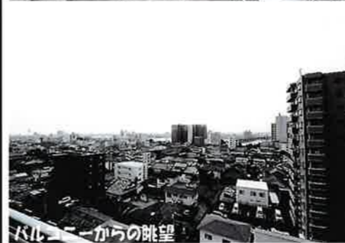
バルコニーからの眺望