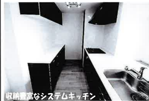
収納豊富なシステムキッチン