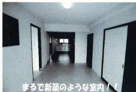
まるで新築のような室内!