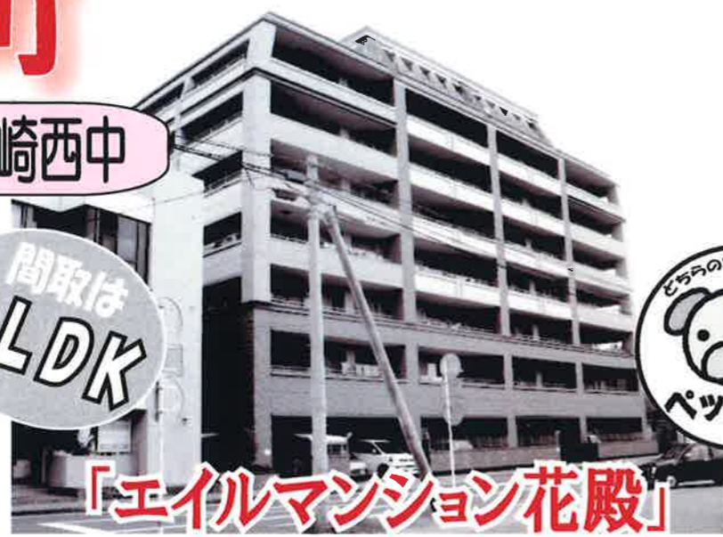
「エイルマンション花殿」