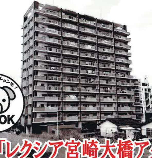
「レクシア宮崎大橋アクアテラス」

POINT 西池小学校まで徒歩約4分の立地ですので通学に安心です！ お買い物にも便利で中心部へのアクセスも良好なので人気☆ 南西の角部屋で下が駐車場なので下階を気にせず生活出来ます！