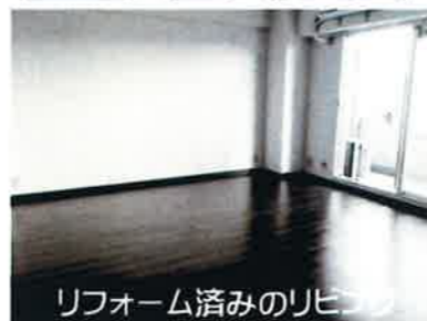
リフォーム済みのリビング

＜ローン返済例＞ ◎月々 45,022 円 (ボーナス払いなし) 1,380万借入れ 30年返済 10年固定 1.1%で計算 別途: 管理費、修繕積立金、駐車場代が必要となります。